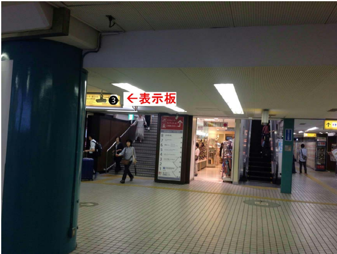
写真 ア 東改札口を出て、正面の表示板 ③番（案内図のC）の階段を見えています。 階段または正面雑貨店右側のエスカレータ（案内図の C）をご利用ください。